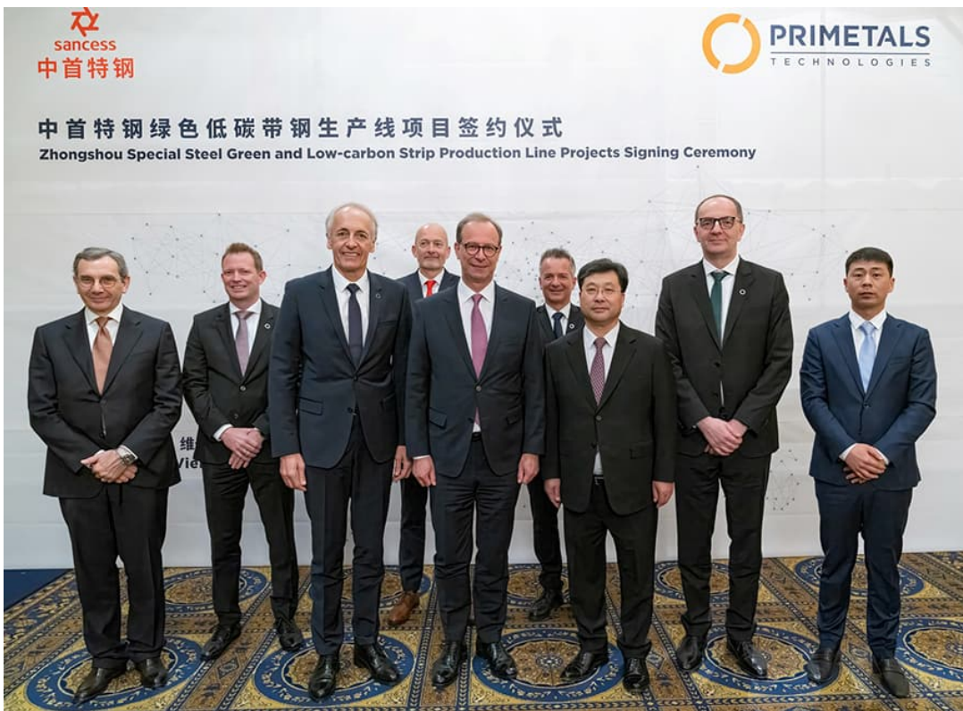
Представители Zhongshou и Primetals Technologies на церемонии подписания в Вене

Данный пресс-релиз и бесплатная фотография к нему доступны по ссылке: primetals.com